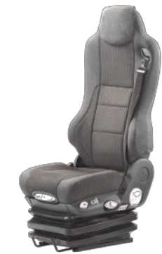
Tourea mit Klima-System

Montagekostenberechnung der Zusatzausstattung erfolgt nach Aufwand!